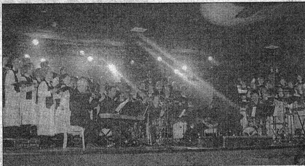
Les soixante choristes de l'Écho des Chutes ont offert une performance remarquable en hommage à Jacques Brel.

l'avait promis il a mis à contribution son talent de comédien qui, ajouté à une voix exceptionnelle, nous a fait vibrer et ressentir l'ensemble des émo-